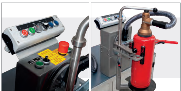
• Zeitsteuerung der Reversierung und elektrische Höhenverstellung.

Die „S“-Version ist die stationäre Variante unseres Erfolgsmodells PSM COMPACT . Besonders einfache Handhabung und schneller Service standen bei ihrer Entwicklung im Vordergrund. Mit ihr schaffen Sie in kürzester Zeit eine hohe Anzahl handelsüblicher Feuerlöscher von 2 bis 12 kg.