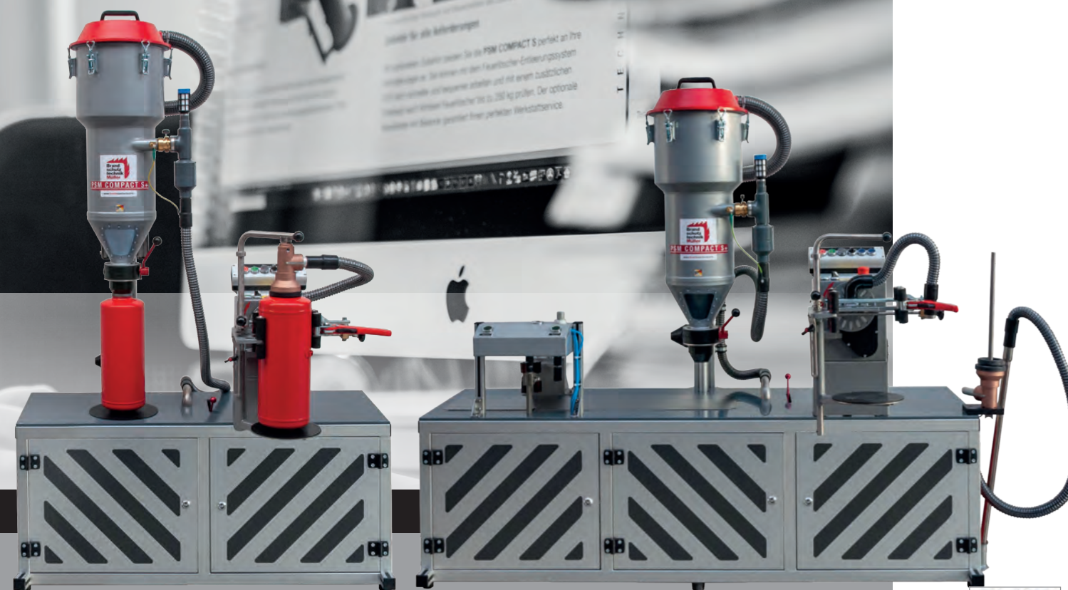
• PSM Compact Stationär mit optional erhältlichem Feuerlöscher-Entleersystem.