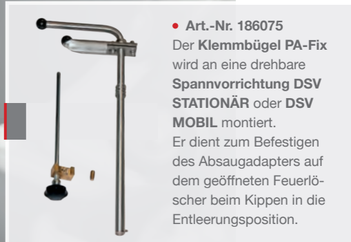
• Art.-Nr. 186075 Der Klemmbügel PA-Fix wird an eine drehbare Spannvorrichtung DSV STATIONÄR oder DSV MOBIL montiert. Er dient zum Befestigen des Absaugadapters auf dem geöffneten Feuerlöscher beim Kippen in die Entleerungsposition.